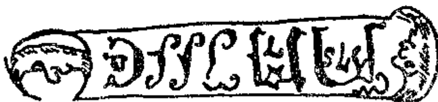
Inscrições de caráter mágico que figuram em armas de proteção Europa Central, século 18

Um fato importante a sublinhar é que todas essas armas provêm de regiões onde o vampirismo já tinha causado estrago: Hungria, Áustria, Sérvia! E, fato igualmente estranho, são todas do tipo alemão e do século 18, grande época do vampirismo.